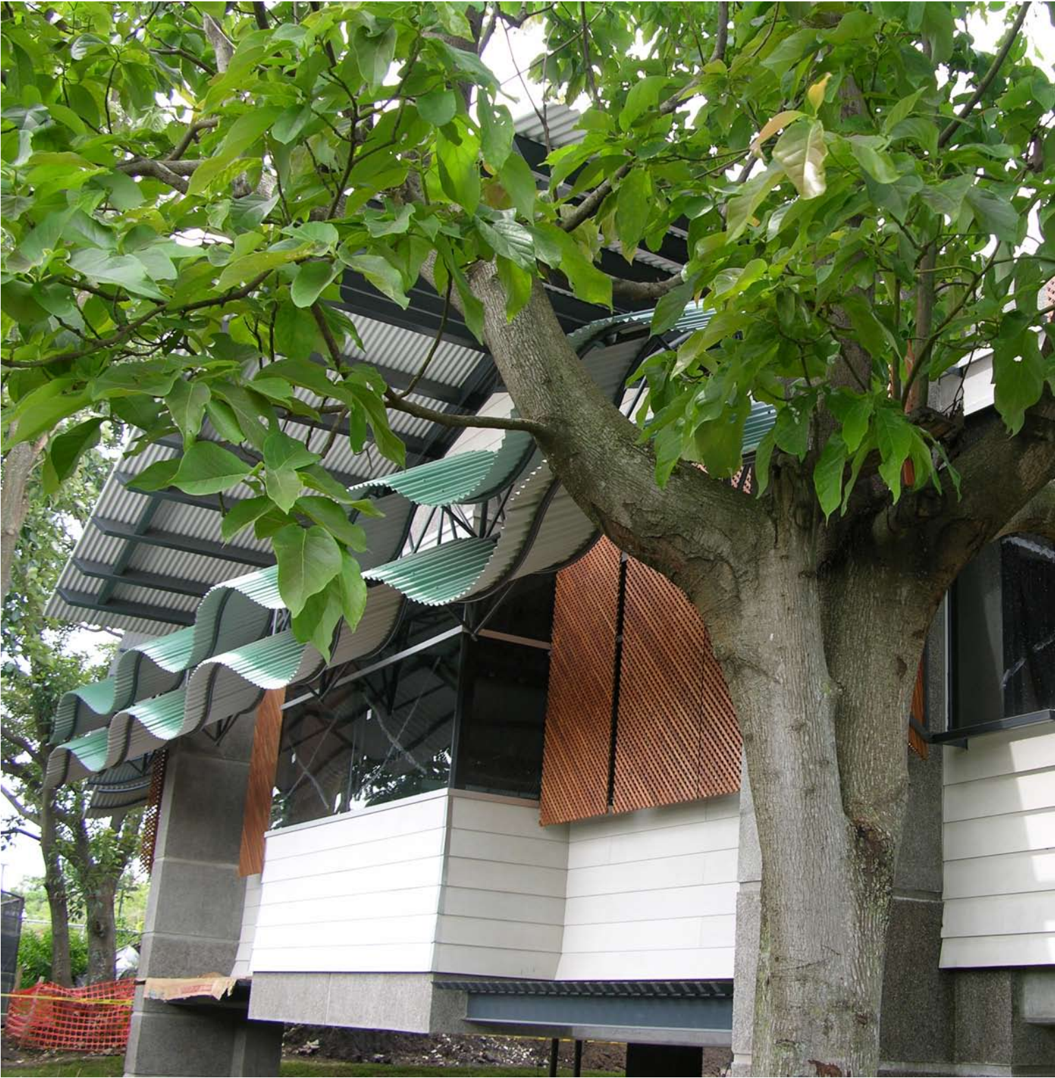
Un árbol grande almacena 13 libras de CO2 x año.